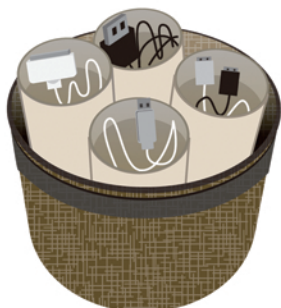
出し入れもラクチン♪

のときに出る生ごみは三角コーナーなどに入れると、つい時間が経ってしまい、ニオイやカビの原因に。かといってビニールに入れると、生ごみに含まれた水分が溜まってしまうのも気になります。そこで、新聞紙やチラシを適当な大きさに切って近くにストック。料理ごとに包んで捨てればニオイやカビの心配もなく、三角コーナーも不要に。その分、三角コーナーやその周辺の掃除の手