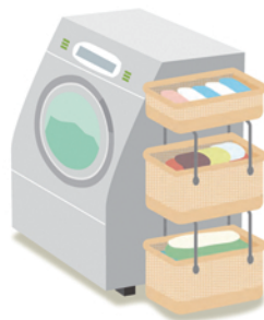
カゴが縦に連結したタイプなら省スペースでできます！